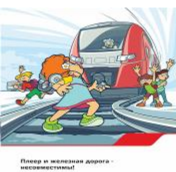
Плеер и железная дорога - несовместимы!