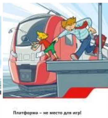
Платформа - не место для игр!

Приближаясь к железной дороге - снимите наушники - в них можно не услышать сигналов поезда!